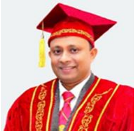
ජ්‍යෙෂ්ඨ මහාචාර්ය ශිරාන්ත හිංකෙන්ද පීඨාධිපති

ශ්‍රී ලංකාවේ ජාතික මට්ටමේ විශ්වවිද්‍යාල අතර මූලිකත්වයෙහි ලා සැලකෙන ශ්‍රී ජයවර්ධනපුර විශ්වවිද්‍යාලයේ මානවශාස්ත්‍ර හා සමාජීයවිද්‍යා පීඨයට අ.පො.ස. උසස් පෙළ විභාගය හොඳින් සමත් වූ ඔබ සෑම බාහිර උපාධි අපේක්ෂකයන් වශයෙන් සාදරයෙන් පිළිගනිමි. මානව සංවර්ධන නිර්ණායක ඔස්සේ බලන කල්හි දියුණු වෙමින් පවතින රටවල් අතර ශ්‍රී ලංකාවට විශේෂ ස්ථානයක් හිමි වන බව අප සැවොම දන්නා කරුණකි. මීට ප්‍රධානතම හේතුව වශයෙන් අධ්‍යාපන සාක්ෂරතාවෙන් ශ්‍රී ලාංකේය ජනතාව වඩාත් ඉහළ ස්ථානයක පසුවීම පෙන්වා දිය හැකිය. එසේ වුවද, තවමත් ශ්‍රී ලංකාවේ උසස් අධ්‍යාපනය සඳහා සුදුසුකම් ලබන අතිදක්ෂ සිසුන්ගෙන් අභ්‍යන්තර සිසුන් වශයෙන් ජාතික විශ්වවිද්‍යාලවලට ඇතුළු වීමට වරම් ලැබෙන්නේ සුළු පිරිසකටය. නමුත් ශ්‍රී ජයවර්ධනපුර විශ්වවිද්‍යාලය “ඉගෙනුම තුළින් ජීවිත සමෘද්ධිමත් කිරීම” යන සිය දැක්මට අනුව අභ්‍යන්තර සිසුන්ට අමතරව දැයේ දරු දැරියන් විශාල පිරිසකට බාහිර උපාධි වැඩසටහන් මගින් උසස් අධ්‍යාපන අවස්ථා සලසමින් සිටියි. එකී සේවාවේ පුරෝගාමී මෙහෙවර ඉටු කිරීමට මානවශාස්ත්‍ර හා සමාජීයවිද්‍යා පීඨයට හැකිවීම එදා මෙදාතුර ලැබූ ඓතිහාසික ජයග්‍රහණයක් බවද පැවසිය යුතුය. මේ වනවිටත් අප පීඨය මගින් බිහි කළ බාහිර උපාධිධාරීන් විශාල ප්‍රමාණයක් රටේ ග්‍රාමීය හා නාගරික ප්‍රදේශවල සේවයේ නියුතු වෙමින් සිටින බව මෙහිදී ප්‍රකාශ කරනුයේ සාඩම්බරයෙනි.