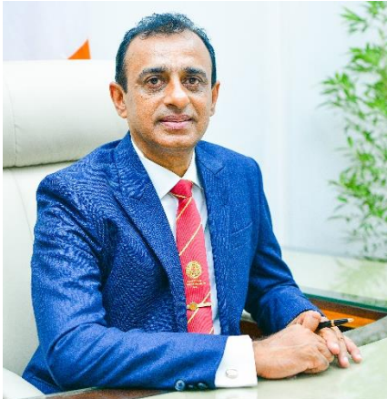
ජ්‍යෙෂ්ඨ මහාචාර්ය එම්.එම්. පක්මලාල් උපකුලපති

ඔබගේ ජීවිතයේ අධ්‍යාපන කඩඉම් ජයගැනුමට දිවයිනේ රාජ්‍ය විශ්වවිද්‍යාල අතුරින් ප්‍රමුඛතම රාජ්‍ය විශ්වවිද්‍යාලයක් ලෙස වසර ගණනාවක පටන් අභිමානවත් ගමනක නිරත වන ශ්‍රී ජයවර්ධනපුර විශ්වවිද්‍යාලය සමග එක්වීම සම්බන්ධයෙන් විශ්වවිද්‍යාලයේ උපකුලපතිවරයා ලෙස ප්‍රථමයෙන් මාගේ සුභාශීංසන එක් කරනු කැමැත්තෙමි.